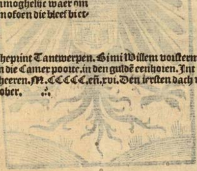
Washington, Library of Congress, Rosenwald Collection 1134, fol. v4 recto

S hepint Tancwerpen. Sini Willem voisterman. buten die Camer poort. in den gulde renhoien. In iac ons heeren. M. CCCC. en. xvi. Den irsten dach van October.